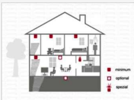
Montageorte Deutschland (mit Klick vergrößern)

Um eine volle Abdeckung zu erzielen, darf der Maximalabstand zwischen zwei Rauchwarnmelder in einem Raum 10 m nicht überschreiten. Ihr Cautiex Rauchwarnmelder darf NICHT in einer Deckenspitze montiert werden. Während eines Brandes sammelt sich heiße Luft in der Mitte der Deckenspitze und verhindert, dass Brandrauch die Sensorkammer Ihres Cautiex Rauchwarnmelder erreichen kann. Um optimale Resultate zu erzielen, platzieren Sie Ihren Cautiex Rauchwarnmelder zwischen 50 cm – 100 cm entfernt von der Deckenspitze.